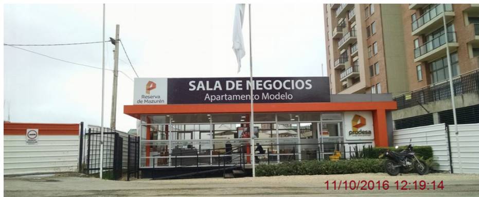
Sala de negocios ubicada en la Carrera 55 No 152 B 68

ALCALDÍA MAYOR DE BOGOTÁ D.C. SECRETARÍA DE AMBIENTE